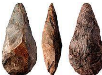
Fig. 6 - Exemplo de Ferramenta de mão biface lanceado

É a essência mesma do “ What could be ”, o “poderia” que vai deixando de lado o peso dos perceptos ordinários e, no seu lugar, dando espaço para novas possibilidades e nova vida que emergem em nossa mente à medida que passamos a desejar diferentemente as coisas que o mundo contém - princípio mesmo da inventividade, como que se vivêssemos sempre um eterno retorno Nietzscheano de positividade, buscando a reafirmação da vida.