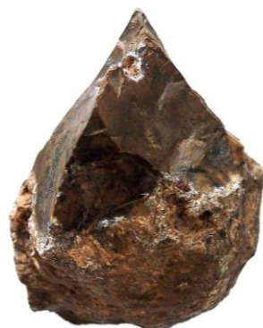
Fig 2 - Seixo talhado no período Olduvaiense – cerca de 2.0 milhões de anos.

Nesses primórdios, havia ocorrido uma grande mudança no clima global e amplas savanas e espaços abertos surgiram na África. Gradualmente fomos deslocando nosso habitat das árvores para esses campos abertos, que, no entanto, possuíam fontes de alimentação mais diversificadas.