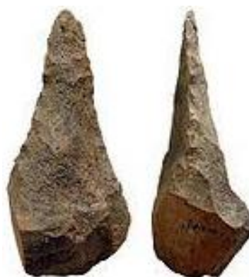
Fig. 7 - Exemplo de Ferramenta de mão biface período Micoquense

As distorções que as ferramentas gradualmente iam ganhando nos mostram que a fantasia ou o fantasiar em fictos (recriações livres das formas) iam gradualmente ganhando o campo do imaginário e reconfigurando as ferramentas sem uma finalidade definida, como se o