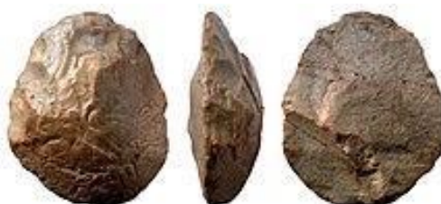
Fig. 9 - Exemplo de Ferramenta de mão biface em forma ovóide do período tardio Acheulense

Nesse ponto teríamos mais dois princípios de inteligibilidade senciente, o abstrairia e o conceituaria que poderiam ser discutidos como necessários para a realização dos artefatos nos períodos tardios da cultura Acheulense .