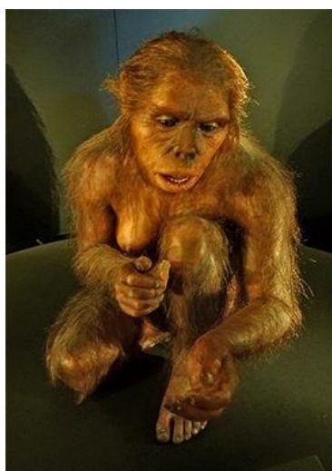
Fig. 1 - Homo Habilis – Reconstrução no Museu da Evolução Humana, Burgos, Escultura de Elisabeth Daynes (2010) baseada no KNM-ER 1813 crânio (Koobi Fora, Kenya, Data 1.9 Ma).