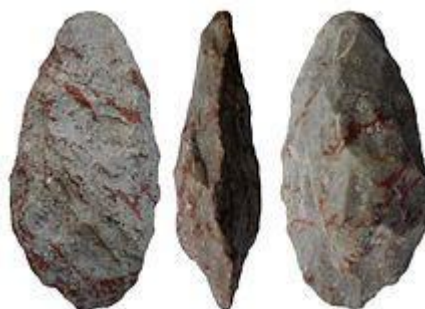
Fig. 8 - Exemplo de Ferramenta de mão biface em forma de elipse do período tardio Acheulense